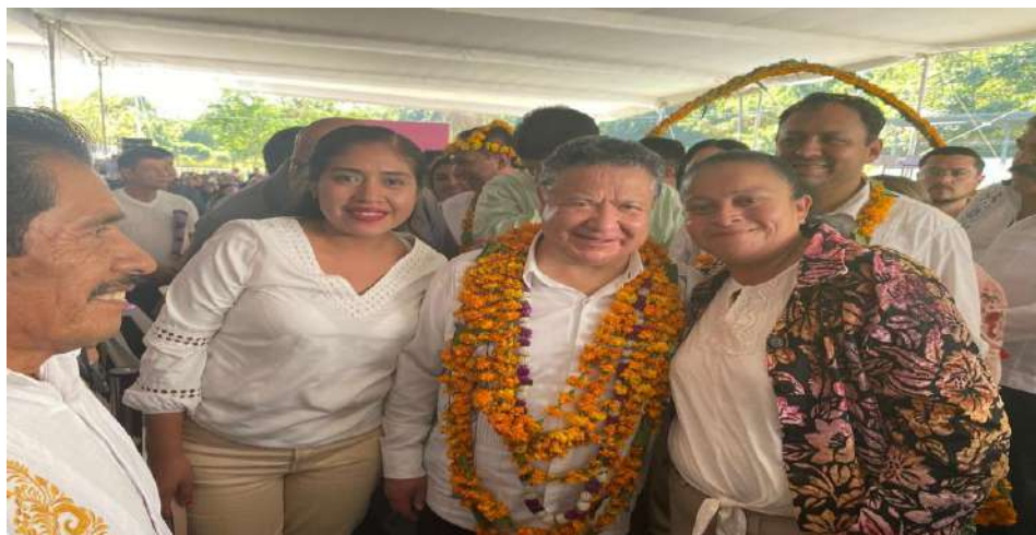
RUTAS DE TRANSFORMACION CON EL GOBERNADOR DEL ESTADO DE HGO.