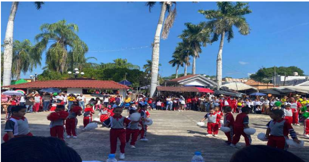
20 DE NOVIEMBRE REVOLUCION MEXICANA