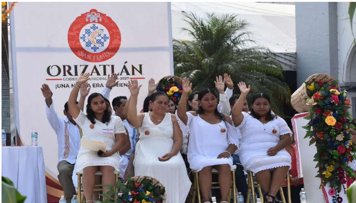
TOMA DE PROTESTA