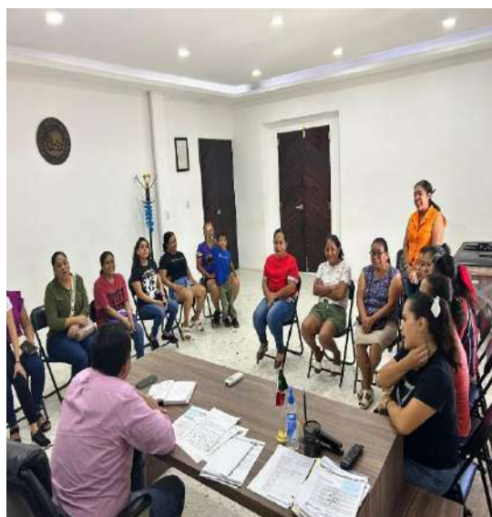
ATENCIÓN CIUDADANA Y AUDIENCIAS CON EL PRESIDENTE MUNICIPAL.