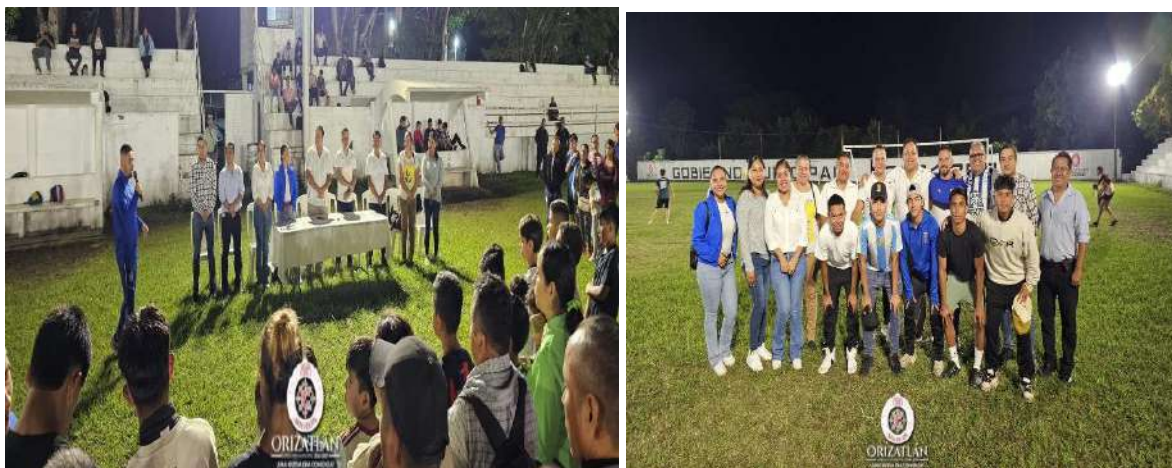
21 DE NOVIEMBRE 2024: NUESTRO MUNICIPIO DIO APERTURA A ESCUELA DE FUTBOL- AHORA FILIAL TUZOS DE PACHUCA