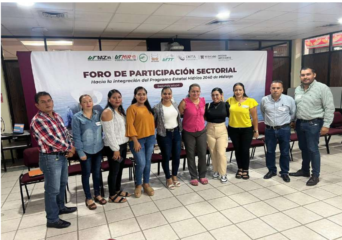
10 DE OCTUBRE PARTICIPACION EN FORO