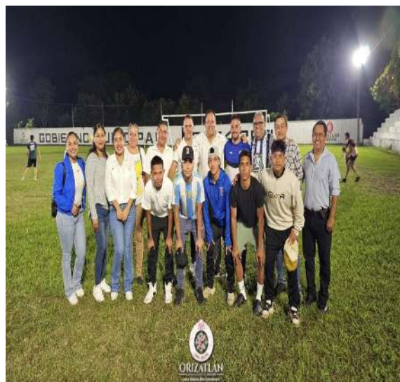
21 DE NOVIEMBRE 2024: NUESTRO MUNICIPIO DIO APERTURA A ESCUELA DE FUTBOL- AHORA FILIAL TUZOS DE PACHUCA