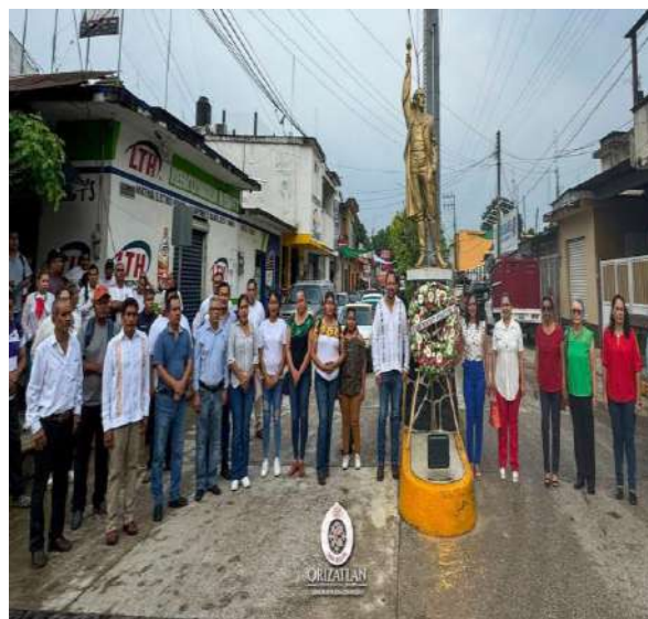
CONMEMORACION DE INDEPENDENCIA DE MEXICO