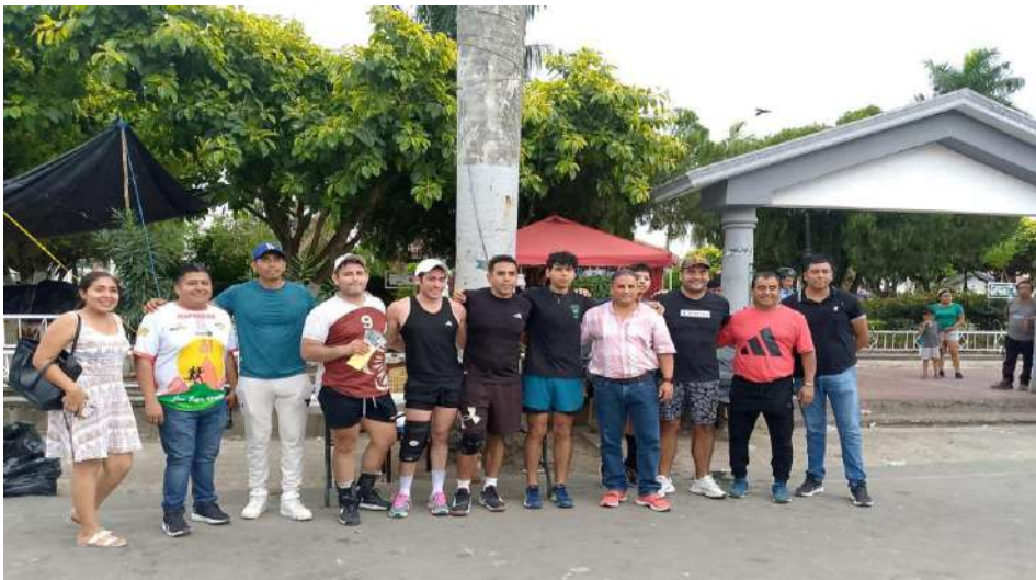
21 DE ABRIL 2025. PRESENTE EN LA ENTREGA DE PREMIOS DEL TORNEO DE TENIS- SEMANA SANTA