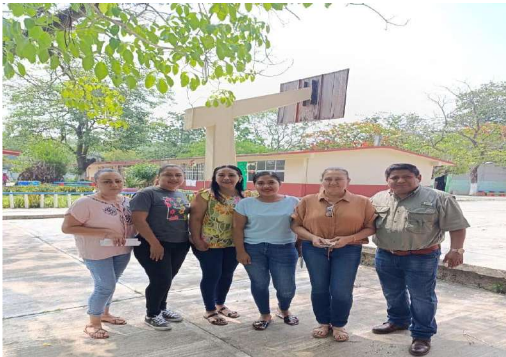
11- DE JUNIO APOYO PARA UN ENCUENTRO NACIONAL DEPORTIVO.