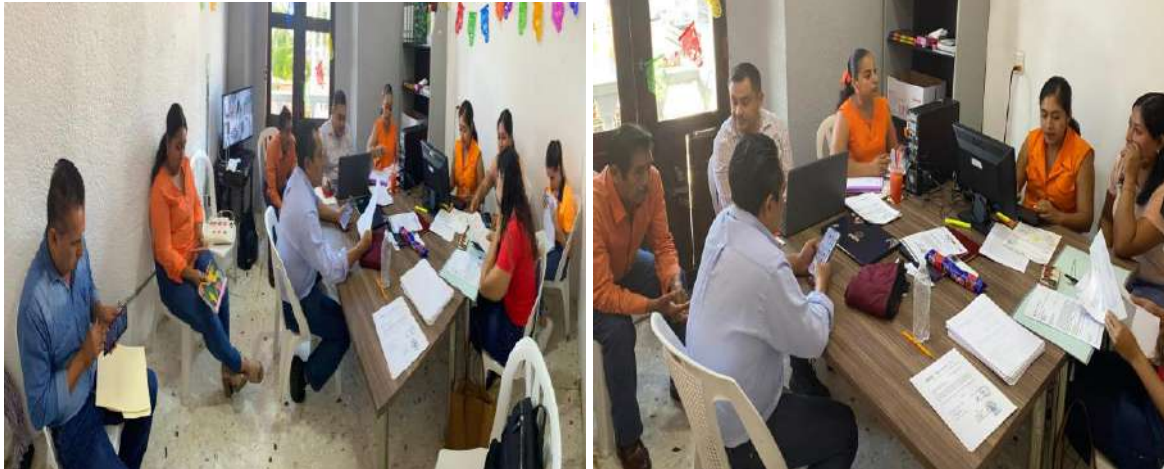
MESAS DE TRABAJO Y SESIONES EN OFICINA SOBRE EL FONDO EDUCATIVO.