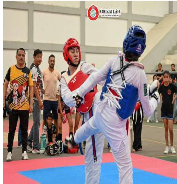
16 DE AGOSTO TORNEO DE KARATE DO