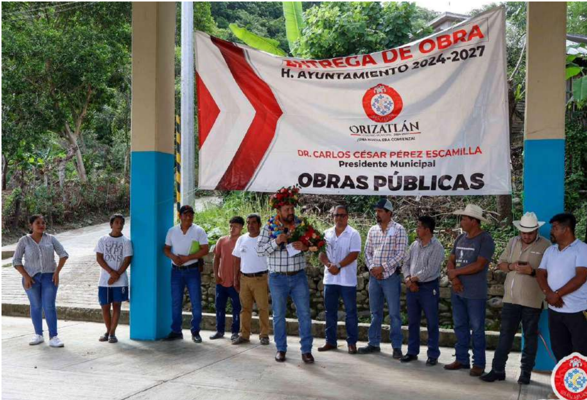
CUARTOS DORMITORIOS HUITZILINGUITO.