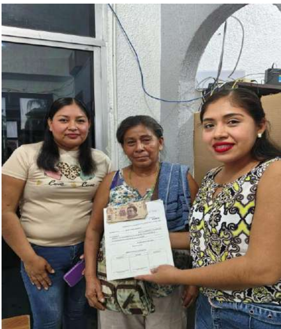
PROLONGACION 20 DE NOV

Fueron gestionados varios apoyos economicos