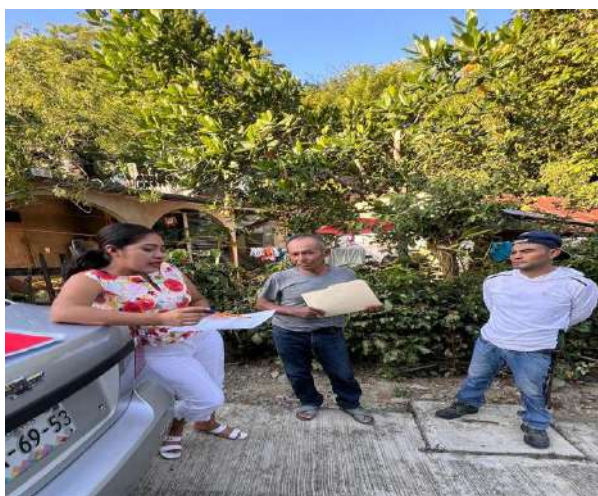
Atención a pueblos y comunidades indígenas