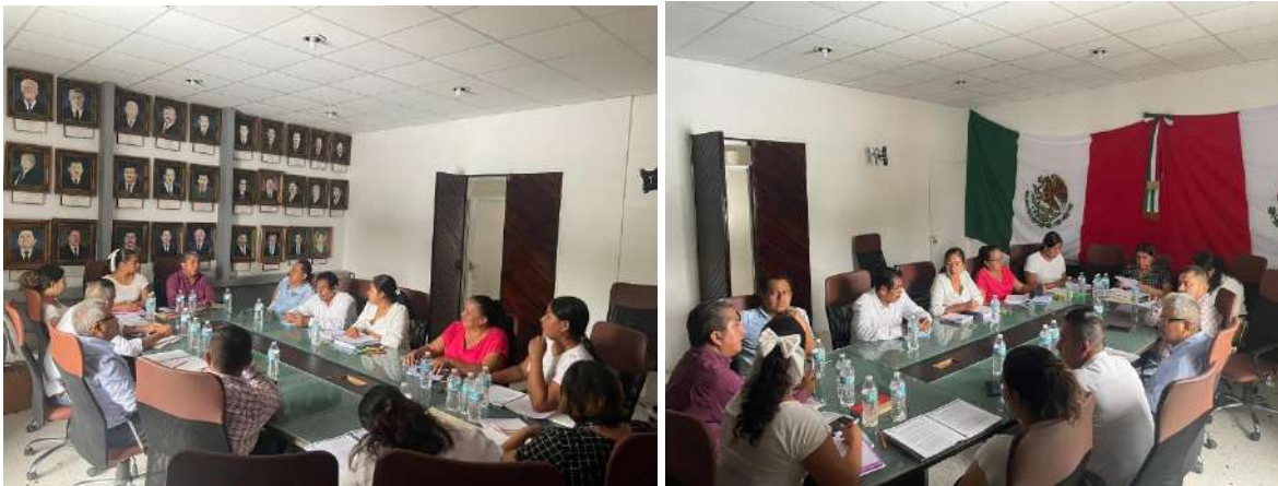
COMISION DE HACIENDA MUNICIPAL: ESTUVE PRESENTE EN DIVERSAS CAPACITACIONES Y REUNIONES.