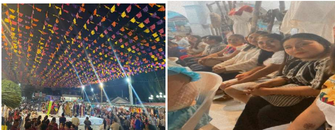
28 DE NOVIEMBRE FESTIVAL HUASTECO.