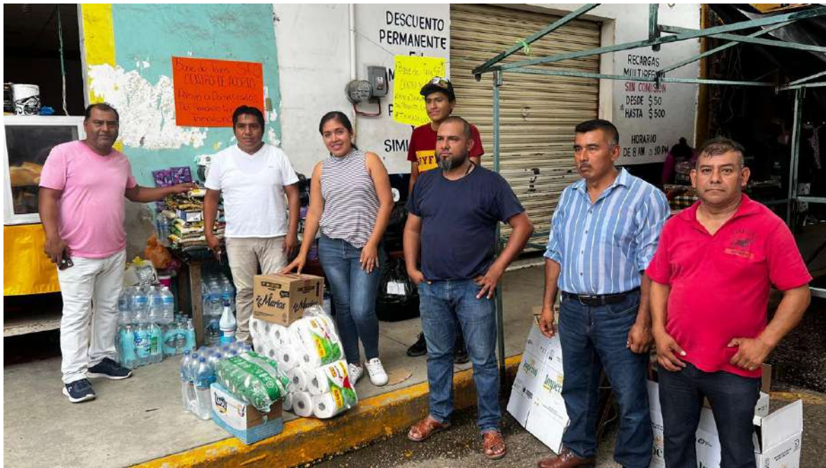
GREMIO DE TRASPORTISTAS