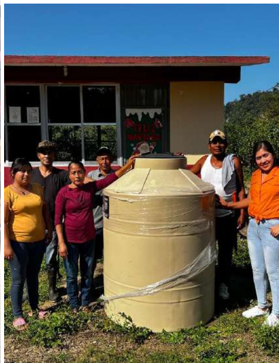
VENTILADORES Y ROTOPLAS AHUAIXPA ORIZATLAN.