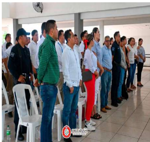
29- MAYO 2025- PRIMERA SESION ORDINARIA COPLADEM