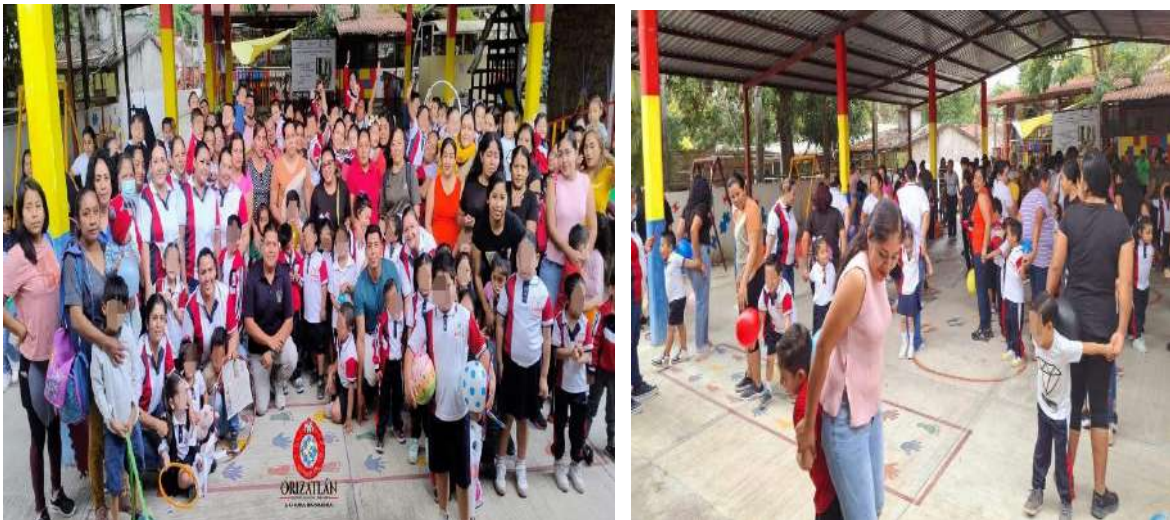
ACTIVIDADES DE MACROGIMNACIA EN CENTROS EDUCATIVOS - INJUDE